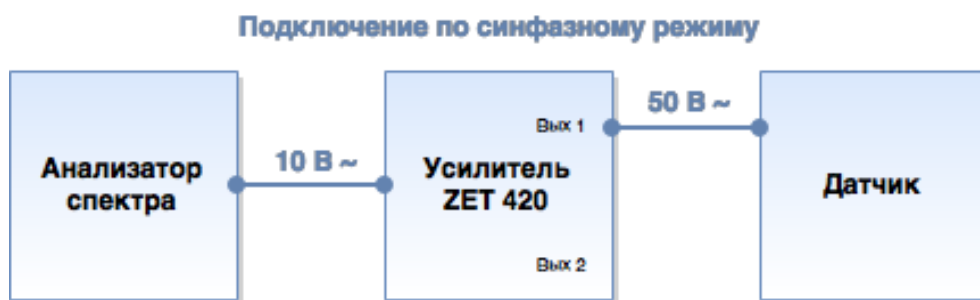
Рис. 6.1 Подключение ZET 420 по синфазному режиму