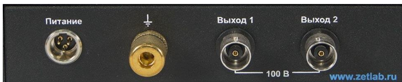
Рис. 4.3 Задняя панель высоковольтного усилителя ZET 420

На Рис. 4.3 представлена задняя панель высоковольтного усилителя ZET 420, а в Табл. 4.2 приведено назначение элементов панели.