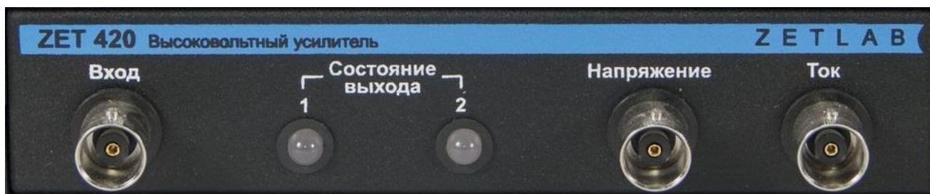
Рис. 4.2 Лицевая панель высоковольтного усилителя ZET 420

На Рис. 4.2 представлена лицевая панель высоковольтного усилителя ZET 420, а в Табл. 4.1 приведено назначение элементов панели.