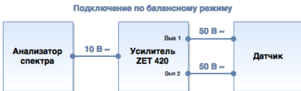
Рис. 6.2 Подключение ZET 420 по балансному режиму