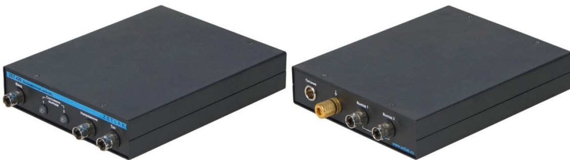
Рис. 4.1 Внешний вид высоковольтного усилителя ZET 420

На Рис. 4.1 представлен внешний вид высоковольтного усилителя ZET 420.