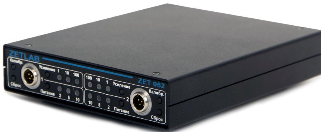
Рис. 4.1 Лицевая панель тензоусилителя ZET 052

На Рис. 4.1 представлена лицевая панель тензоусилителя ZET 052.