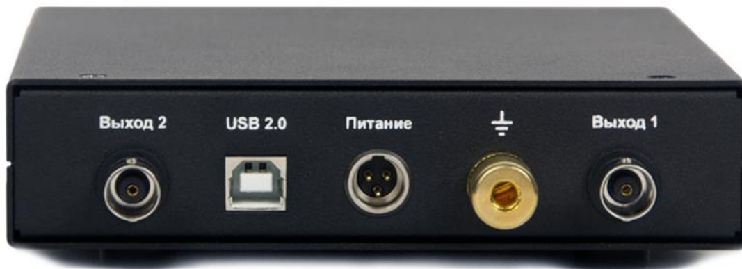
Рис. 4.2 Задняя панель тензоусилителя ZET 052

На Рис. 4.2 представлена задняя панель тензоусилителя ZET 052.