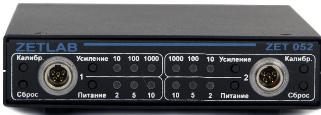
Рис. 4.1 Лицевая панель тензоусилителя ZET 052

На Рис. 4.1 представлена лицевая панель тензоусилителя ZET 052.