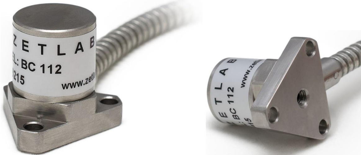
Рис. 3.1 Внешний вид акселерометра ZET 112

На Рис. 3.1 представлен внешний вид акселерометра ZET 112. Датчик оснащается несъемным соединительным кабелем для подключения к контроллеру сбора данных через усилитель заряда ZET 440.