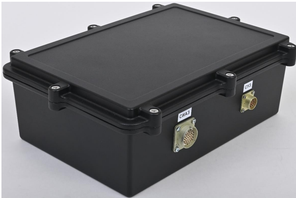
Рис. 1.1 Внешний вид сейсмодатчика в промышленном исполнении

На Рис. 1.1 представлен внешний вид сейсмодатчика, выполненного в промышленном исполнении.