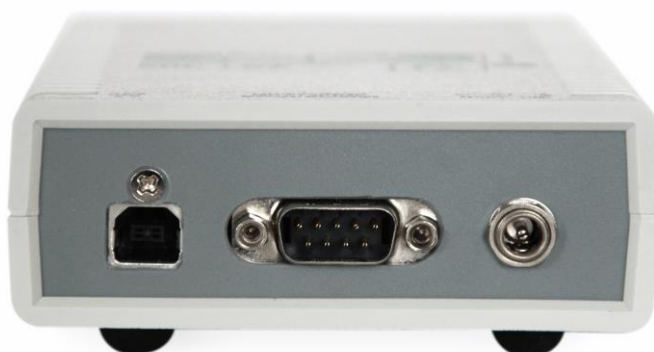
Рисунок 9.2 Общий вид ZET 302 со стороны задней панели.