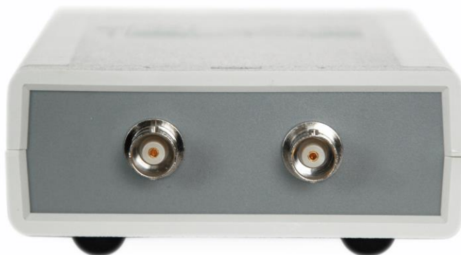
Рисунок 9.1 Общий вид ZET 302 со стороны передней панели. Входные каналы осциллографа.