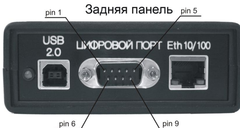
Рисунок 8.1 - Общий вид модуля АЦП-ЦАП ZET 230 со стороны задней панели

Логические уровни «0» = 0 В, «1» = +3.3 В.