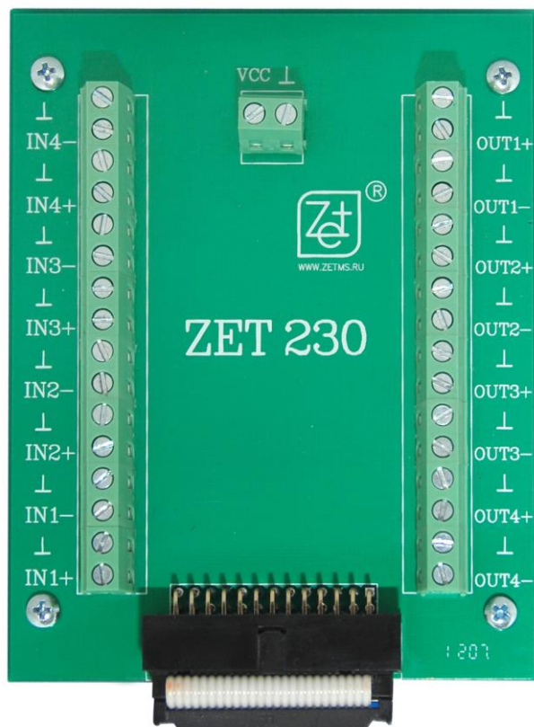
Рисунок 8.5 – Общий вид клеммной колодки

Клеммы «↓» клеммной колодки используются при синфазном включении входов/выходов как «общие», при дифференциальном включении должны использоваться как «средняя точка».