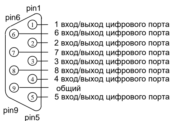
Рисунок 8.2 - Назначение выводов разъема DB-9