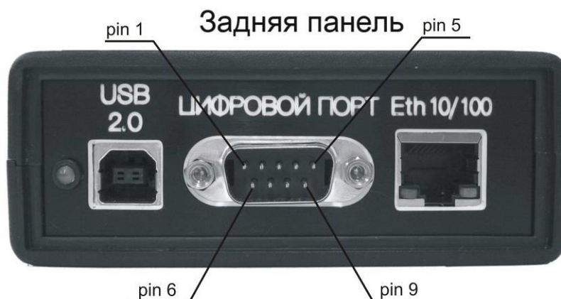
Рисунок 8.1 - Общий вид модуля АЦП-ЦАП ZET 220