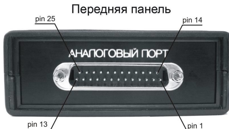
Рисунок 8.3 - Общий вид модуля АЦП-ЦАП ZET 220